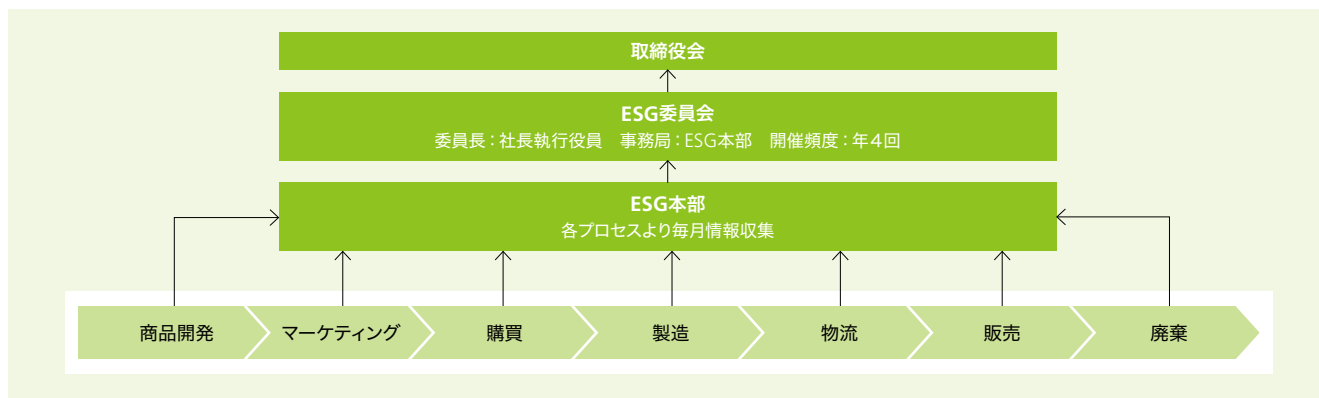
P.8 サステナビリティ推進体制